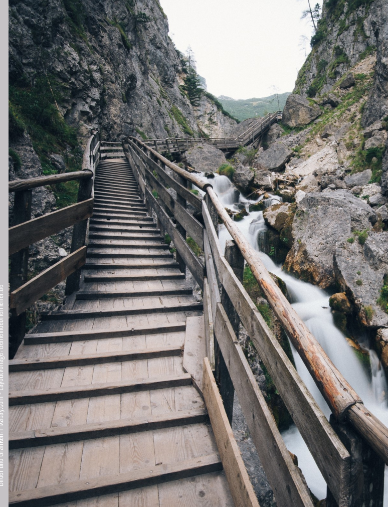
Bilder und Grafiken: Pixabay.com - Layoutvorlage: GemeindefachHeiler.de

Sie erhalten dann an Ihre E-Mail-Adresse einen Einladungslink, den Sie ab ca. 20 Minuten vor Beginn der virtuellen Veranstaltung anklicken können. Bitte betreten Sie den virtuellen Raum rechtzeitig, damit wir Ihnen ggf. noch bei technischen Problemen helfen können.